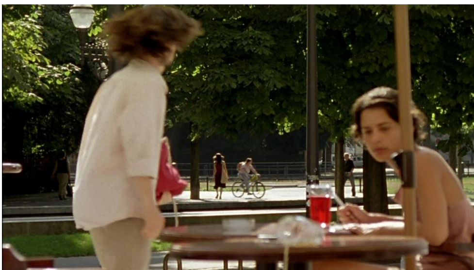
Fig. 3. Abandono del café e inicio de la persecución de esa mujer que le ha cautivado.

Toda esta escena de la terraza del café y la persecución de la mujer nos trae a la memoria un fragmento del relato El hombre de la multitud , de E. A. Poe, en el que el escritor estadounidense narra: