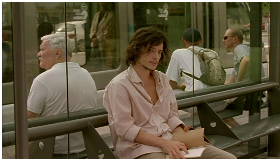
Fig. 5. Imagen del protagonista, sentado en la parada de tranvía, donde continuará su actividad observadora.

Podría decirse a propósito de su función que Guerin consigue así dar un paso hacia delante en la utopía del flâneur cuyo regocijo máximo se encontraría en la posibilidad de observar a una gran cantidad de personas desde el incógnito absoluto. Estas dos premisas vienen a ponerse de manifiesto precisamente en este lugar ya que como lugar de “estacionamiento” para el transporte público va a constituirse como un lugar de gran concurrencia y diversidad 3 de gentes que, además, van a detenerse aunque sea solo por unos segundos (en el mejor de los casos incluso minutos) permitiendo al flâneur llevar a cabo su actividad con mayor desahogo (un análisis más completo) y, por otro, va a permitirle mantenerse invisible en lo que respecta a su actividad, a los ojos de los demás ya que nadie va a cuestionarse la “espera” de alguien en un lugar habilitado para tal menester. El flâneur puede por fin abandonar “la esquina” donde su larga estancia levantaba sospechas y ocupar este nuevo puesto que, además, se encuentran por toda la ciudad.