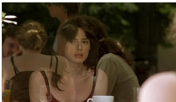
Fig. 2. Imagen, a través del cristal del café, de la mujer que le ha fascinado.

Como habíamos comenzado diciendo, no será la observación el único rasgo que define al flâneur . Otra de las características que lo determinan es la curiosidad. La observación de la multitud que el protagonista lleva a cabo en la terraza del café se verá interrumpida al descubrir en el interior del mismo, a través del cristal, una fisonomía que en algún modo le ha fascinado (fig. 2).